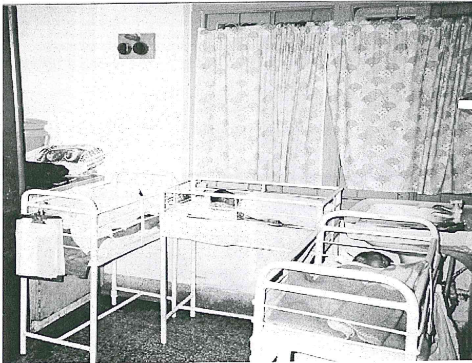
Ett av de mindre rummen med 6 barn.

Normalt finns det mellan 40 – 50 barn på barnhemmet. Det är ca 40 personer som arbetar i olika skift 14 stycken åt gången. Alla barnen är små – runt ett halvår. Endast i undantagsfall finns det barn över ett år. De barn som inte kan placeras för adoption flyttas över till andra barnhem.